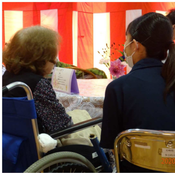
ご利用者の話しに寄り添って

※ 当法人では、事業並びに事務などに関する情報を法人事務所（光峰苑）において閲覧できるようにして 情報開示に応じております。閲覧ご希望の方はご来苑時にお申し出下さい。ご不明な点は、事務局まで ご連絡ください。 事務局TEL：018-868-1188