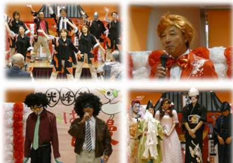
昨年の合同敬老祭の様子

今年も光峰苑グループの敬老会の時期が近付いて参りました。現在、成功に向けて日々検討を重ねているところです。毎年職員が一つひとつ自分たちで作っている敬老祭、当日は職員一致団結しご利用者の方々に楽しんで頂けるよう頑張っていく予定です。今年も各部署毎に開催を予定しております。各部署とも試行を凝らした内容となっておりますのでご期待ください。